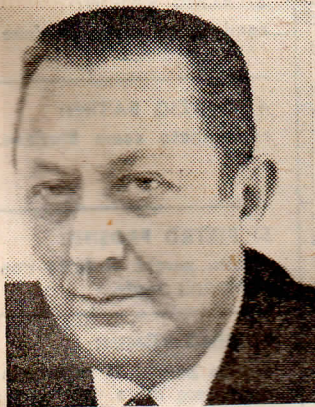
Il dottor Marcello Guida

Il dottor Ferruccio Allitto è il nuovo questore di Milano. Il movimento è stato deciso a Roma, in concomitanza con la nuova destinazione del dottor Marcello Guida, che è stato promosso ispettore generale capo di PS e destinato al ministero.